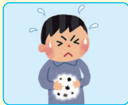
購入品や飲食店などでの食中毒